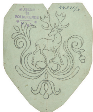
Stickmustersvorlage aus dem Nachlass der Österreichischen Heimatgesellschaft, 1930er-Jahre