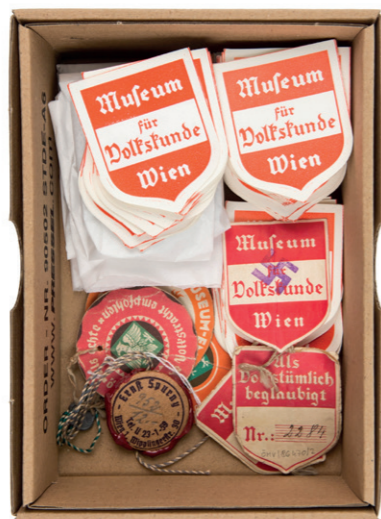
Zertifizierungsmarken der Trachtenberatungsstelle im Volkskundemuseum, Mitte 1930er-Jahre bis 1960er-Jahre