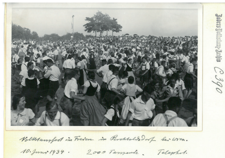
Volkstanzfest, Perchtoldsdorf, 1934