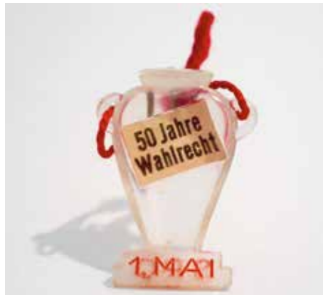
Maiabzeichen, 1957.

Die Eröffnung wird durch eine Gebärdensprachdolmetscherin unterstützt.