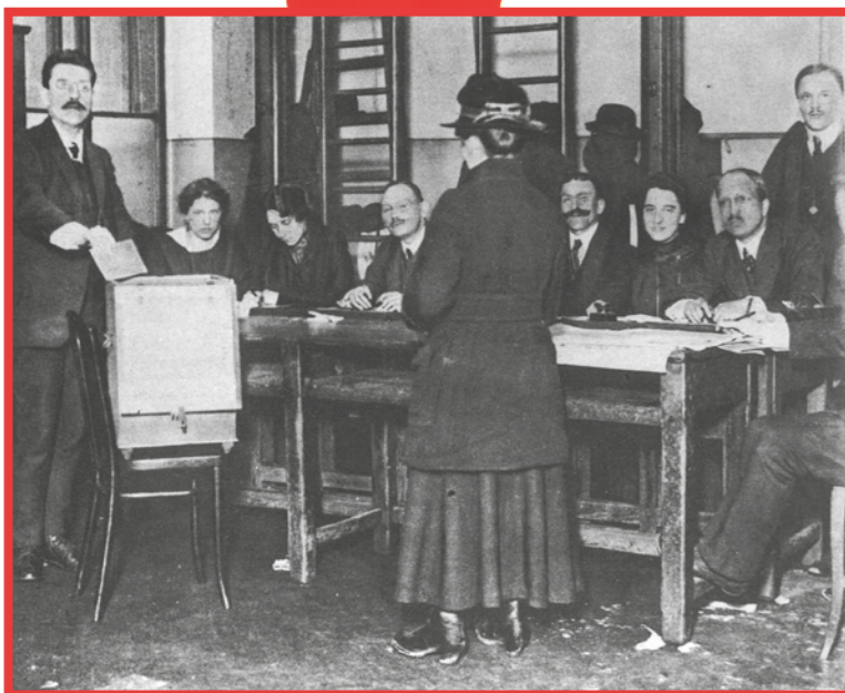
Eine Wählerin bei der Stimmabgabe für die Wahl zur Konstituierenden Nationalversammlung am 16.2.1919.