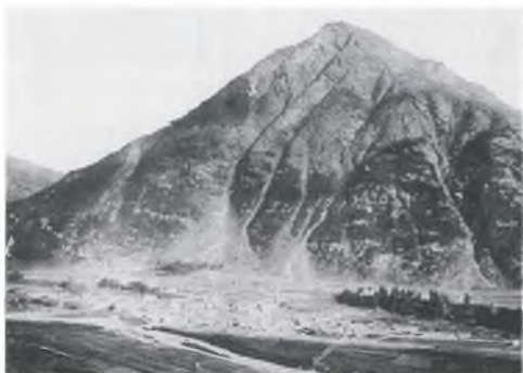
Gesamtansicht von Bessans