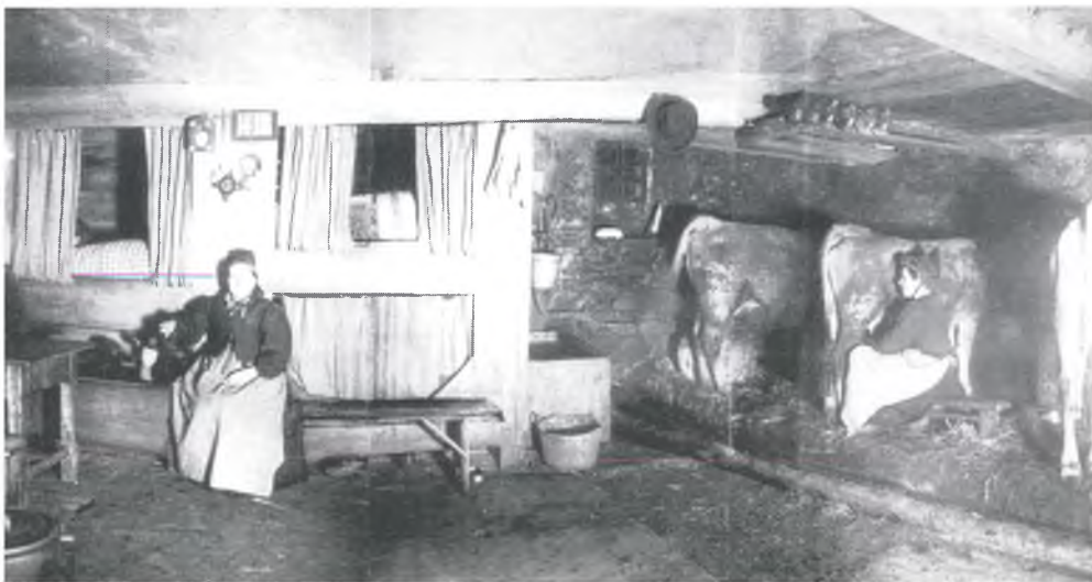
Stallwohnung in Bessans