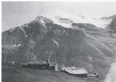
Scheunen der Alpe „La Buffo“ bei Bessans